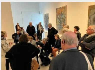
Voyage d'études à Nantes

Exposition temporaire « Gengis Khan » Et musée des Arts