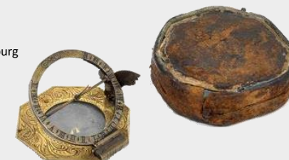
Cadran solaire équatorial d'Augsbourg