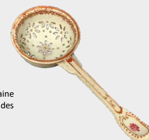
Cuillère à saupoudrer en porcelaine à décor polychrome de guirlandes fleuries. Époque XVIII e siècle